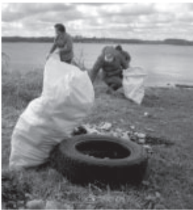
Работники думы в этом году проводили субботник у памятника Аю.

В грандиозной акции по приведению в порядок среды “Большой субботник” в Саласпилсском крае приняли участие более