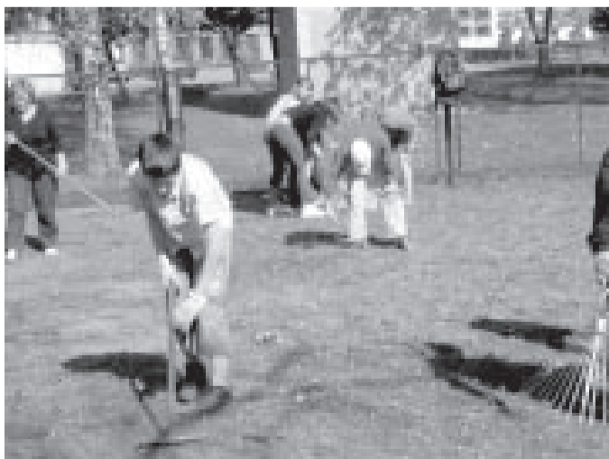
Savas skolas apkārtni kopj Salaspils 1. vidusskolas 5.a klases skolēni