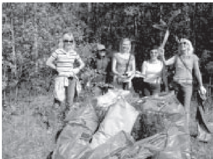
Nepilnas stundas laikā domes darbinieki savākuši ievērojamu atkritumu daudzumu

Secinājums viens – lai pilsēta bū- tu tīrāka, ne vien biežāk vajadzētu rīkot šādas pilsētas sakārtošanas talkas, bet arī atkritumus mest tiem paredzētajās vietās – konteineros! S