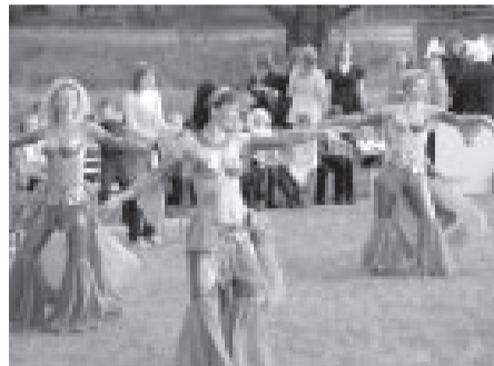
Pasākums "Gaismas dārzs" Botāniskajā dārzā.