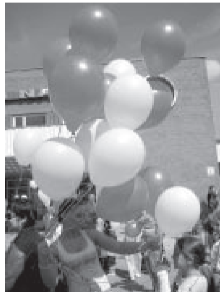
Pasākums "Kājām gaisā" pie k/n "Energētiķis".