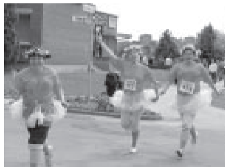
Pilsētas skrējiena dalībnieces.