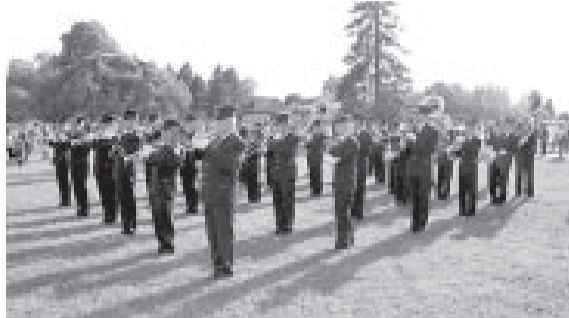
Nacionālo Bruņoto spēku orķestra koncerts Botāniskajā dārzā.