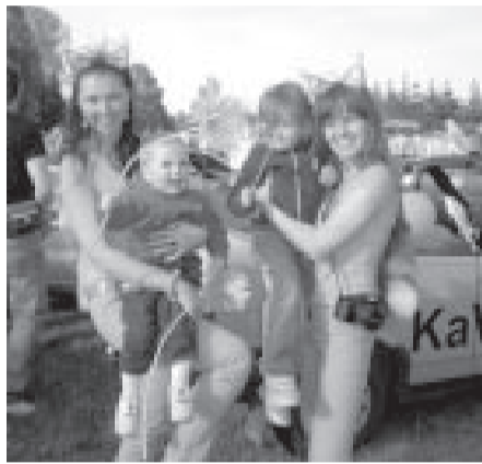
Kabrioekipāža "Vāveres" no Lietuvas. Kabrioekipāžas-2008 uzvarētājas.