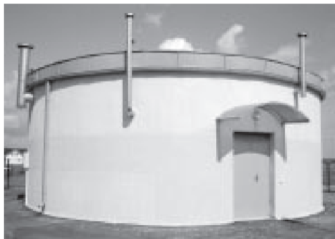
Sūkņu stacija Nometņu ielas raj.

Abu staciju izveide iekļauta projek- ta 800+ jeb "Ūdenssaimniecības attīstība Austrumlatvijas upju baseinos" ietvaros. Projekta kopējās izmaksas sastāda 400 000 Ls lielu summu, no kuras 60% finansēja Eiropas Savienības Kohēzijas fonds. Līdzfinansējums piešķirts arī no Latvijas valsts budžeta. Darbus veica a/s "Venceb".