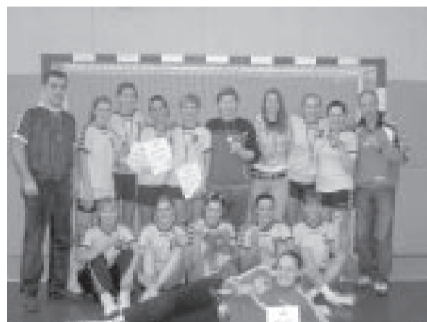
Bērnu sporta skolas audzēknes