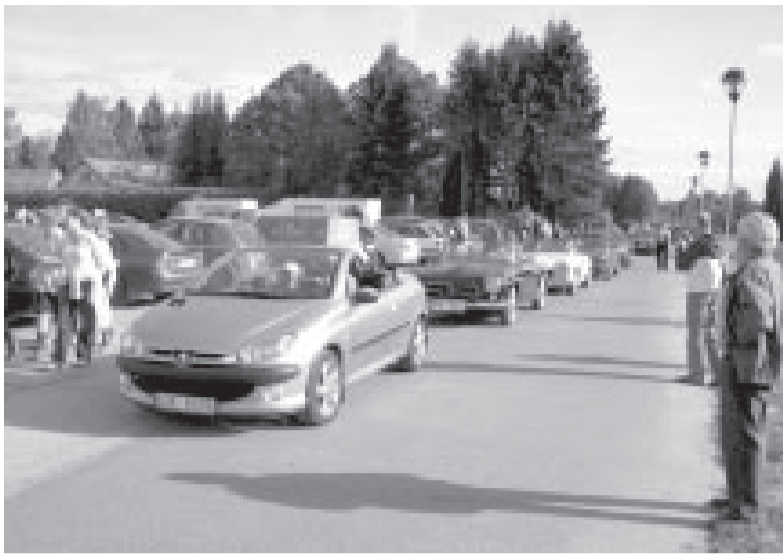
Kabrioletu parāde Nacionālajā Botāniskajā dārzā.