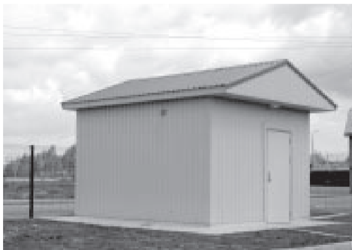
Sūkņu stacija Lauku ielā 5/3

sūkņu stacijā. Nometņu ielas raj. sūkņu stacija ir galvenā un pēdējā pirms attīri- šanas iekārtām, jo tā pārplūstu visus