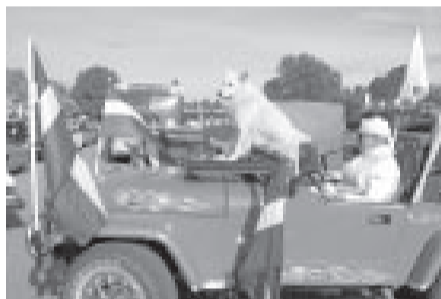
Kabrioekipāža "Baltie vilki".