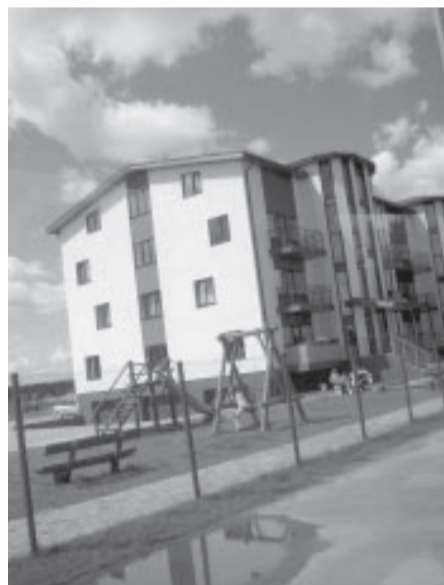
Многokвартирный дом на улице “Малиенас, 2”

Также по-прежнему радует глаз обладатель 1-го места в конкурсе прошлого года – “Эзердрувас”.