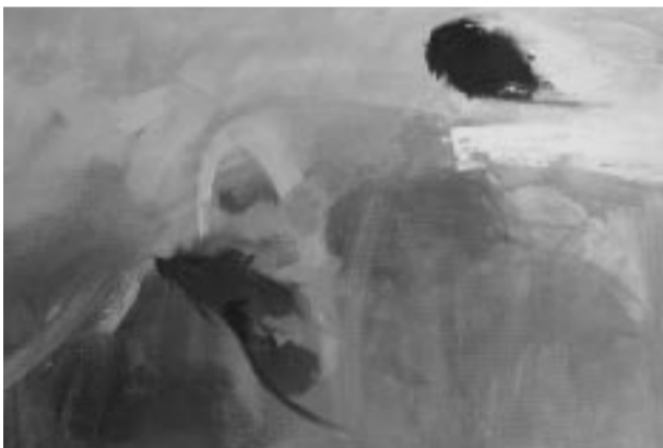
с 16 июля по 3 сентября – выставка картин художницы Аниты Мелдере – “Полет над Стабурагсом”. Выставка посвящена тому, чего больше нет...

Саласпилский дом культуры “Энергетикс” со структурным подразделением – выставочный зал на ул. Ригас, 36 в Саласпилсе