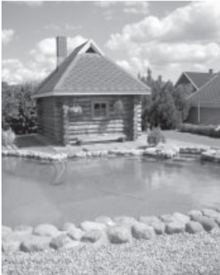
Улица Пляву, 27