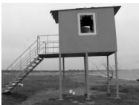
саласпилском пляже, где разгромили пост дежурного. Дежурный пост и раздевалки были установлены

на пляже только этим летом, чтобы благоустроить пляж для нужд жителей. У будки сорваны металлические жалюзи, выбиты окна. Общая сумма нанесенного ущерба – примерно 700 латов.