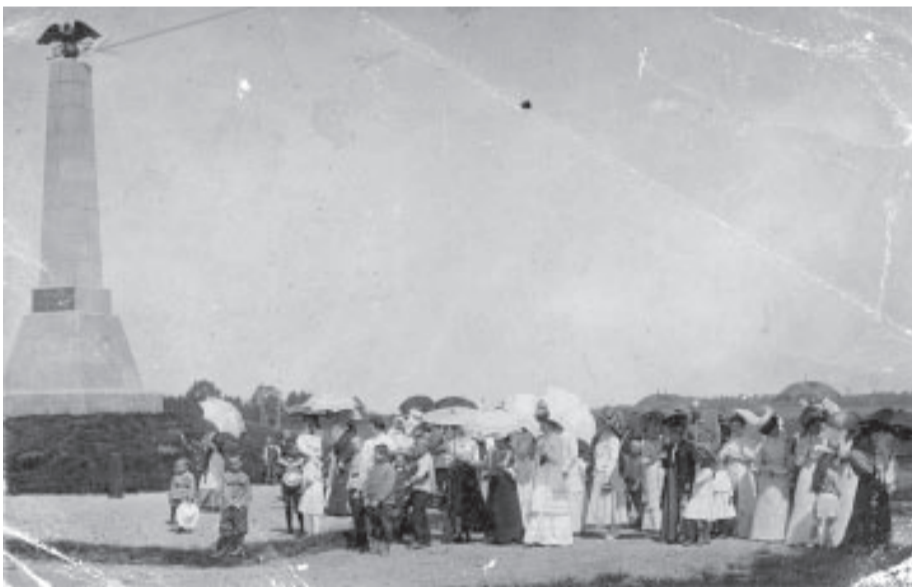
Вид на памятник. 1910 год